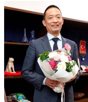
長谷部健渋谷区長

※2017年2月7日公開予定、フラワーバレンタイン公式サイト「男子注目！花贈り指南」コーナー： http://www.flower-valentine.com/interview/