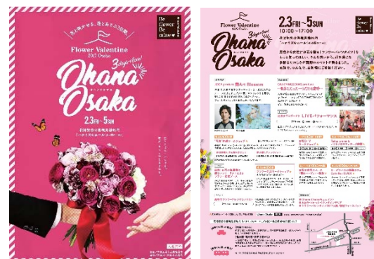
OHANA OSAKA 告知用チラシ

※OHANA OSAKA 公式 Facebook ページ： https://www.facebook.com/ohanaosaka/