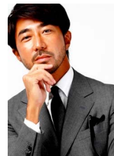
ファッションディレクター 干場義雅氏