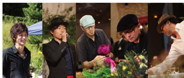
花男子プロジェクト