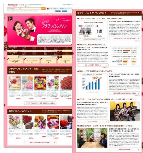
Yahoo!ショッピング内 フラワーバレンタイン特設サイト画面

※Yahoo!ショッピングフラワーバレンタイン特設サイト URL： http://shopping.yahoo.co.jp/event/valentine/flower/y2017/