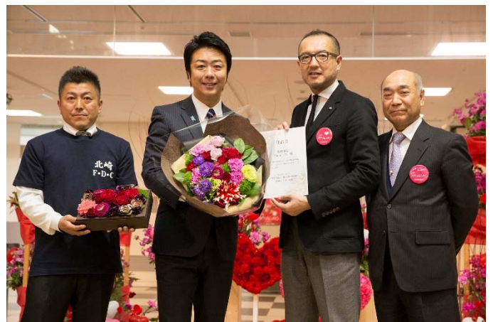
高島市長(左から 2 人目)の就任の様子

フラワーウォークでは、福岡県内最大の繁華街である福岡市中央区天神地区にて市民に花束を渡しながらか歩き、道行く方の注目を集めました。