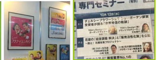
ヌボ一花店山崎社長と小川でセミナー開催も