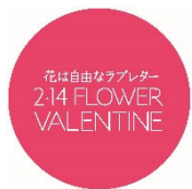
オリジナル缶バッジ 3枚（直径76mm）