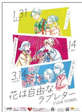
3LOVE STORIES ポスター1枚（A2判）