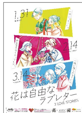
3LOVE STORIES ポスター1枚（A2判）