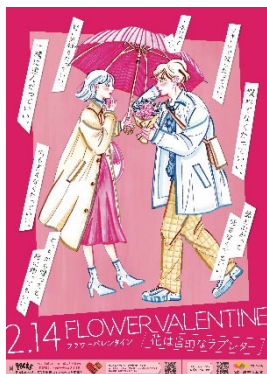
フラワーバレンタイン ポスター2枚（A2判）