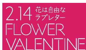
車両用マグネット1枚 （W297×H150mm）