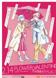
消費者向けチラシ 500枚（A5）